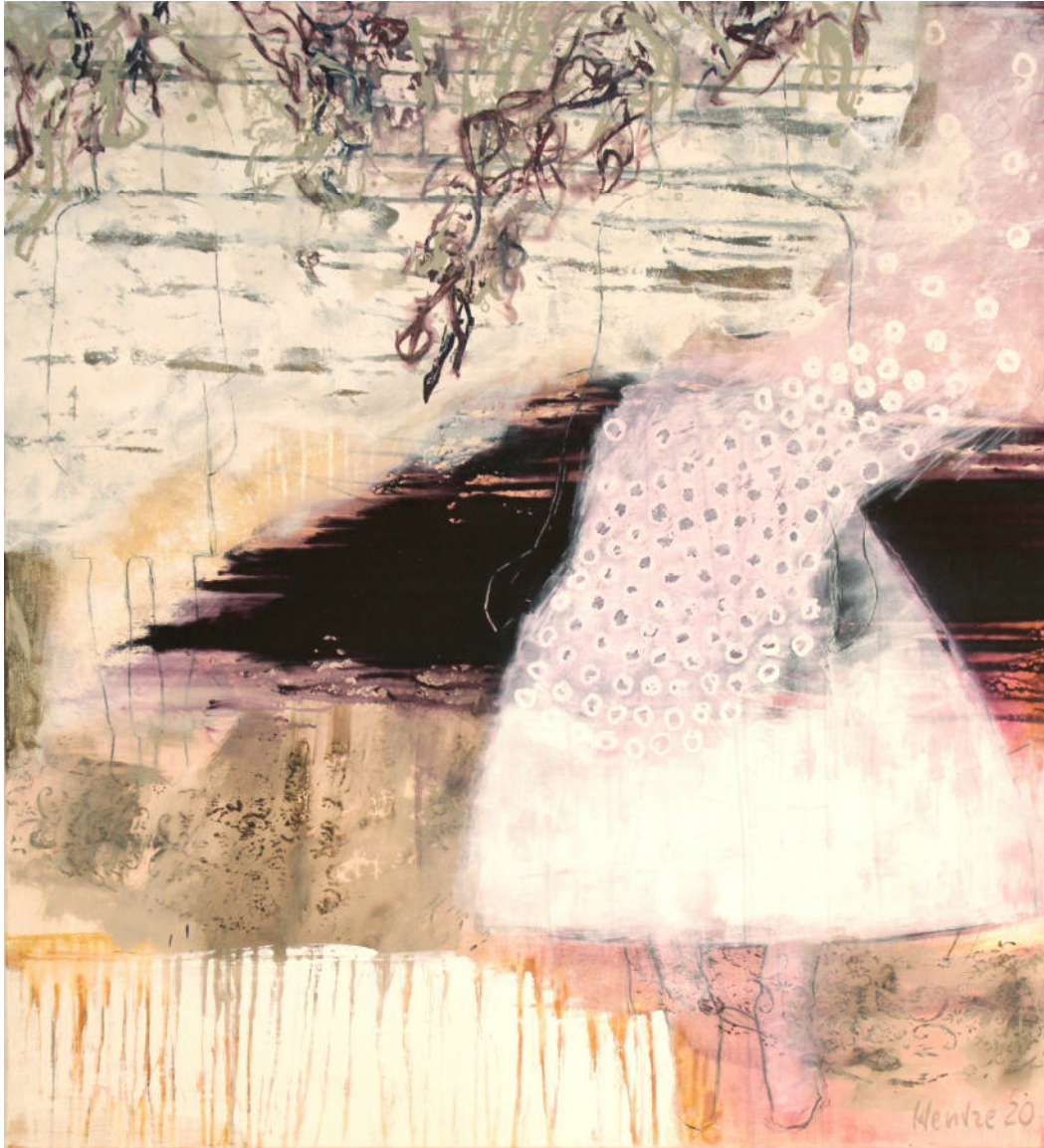
Verschwenderische Poesie 2020, Acryl, 120 x 110 cm