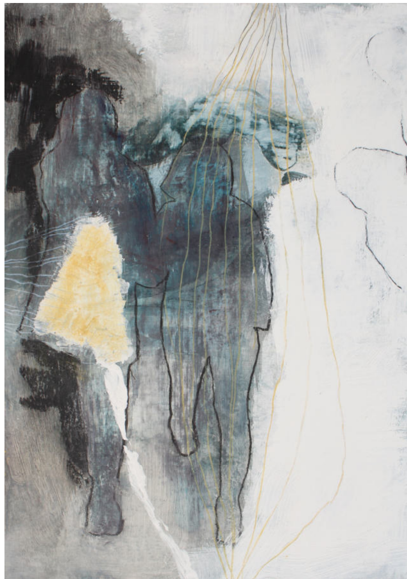
Transcendenz Nr. 9, 10 2022, Tempera auf Karton, 33 x 23 cm