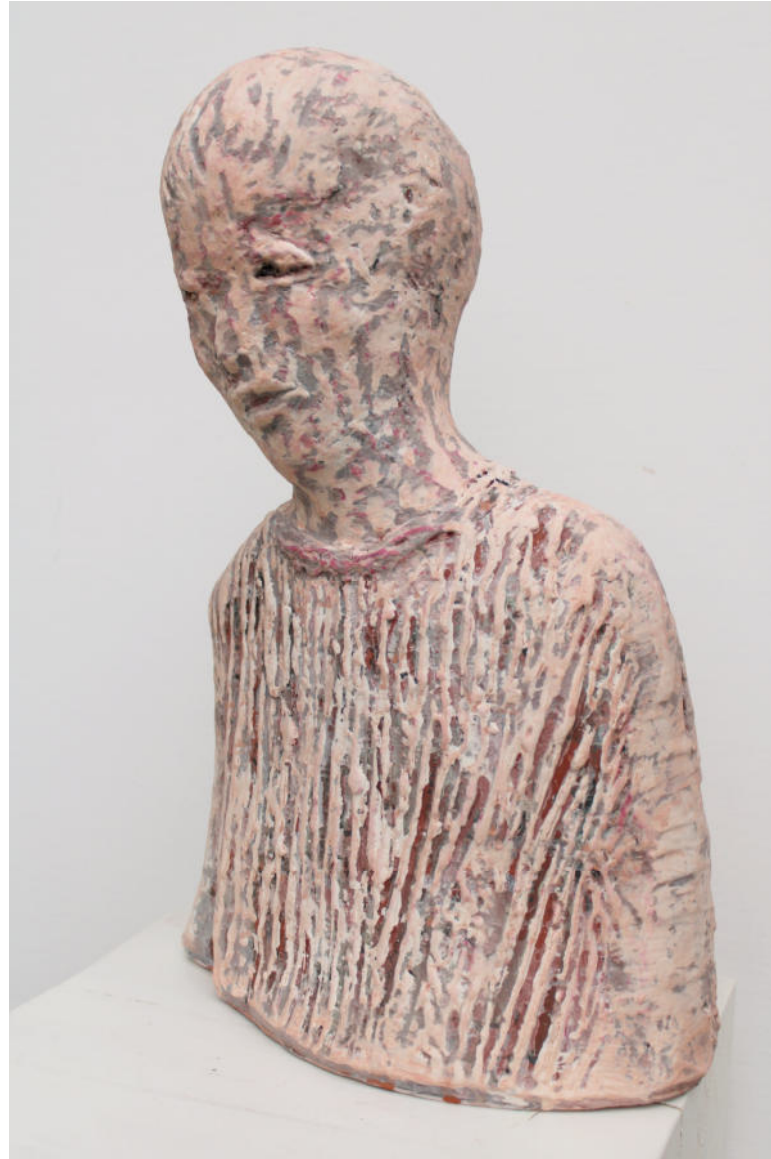
Die Hinterhältige aus der Reihe Insgeheim 2023, Ton bemalt mit Pigment und Eitempera, 40 x 25 x 15 cm