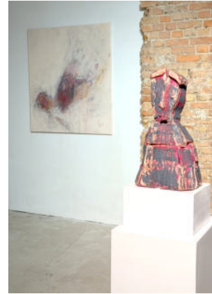
Ausstellung Bridging Cultures im Kühlhaus Berlin