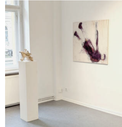
Ausstellungsansicht in [M] Produzentengalerie, BBK Brandenburg, Potsdam