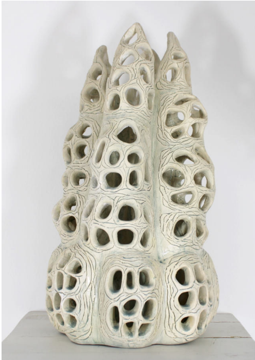
Ethereal Elegance - Die Kunst der Radiolarie 2023, Ton gebrannt und glasiert, 36 x 20 x 20 cm