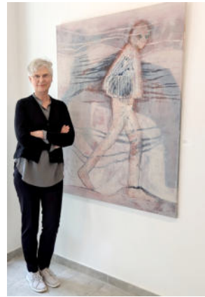
Ausstellung in der GEDOK Galerie Berlin in 2025, Traum – Wirklichkeit – Künstliche Welten