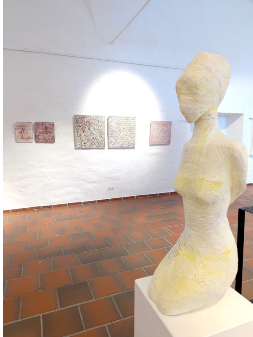
Kleiner Zitronenfalter 2016, Ton, 77 x 21 x 28 cm

Ausstellung „Frühling lässt sein blaues Band...“ Kunsthalle Kempten